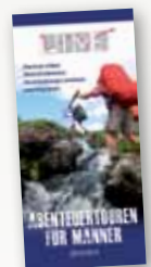
Der Flyer „Abenteuertouren für Männer“ kann bei LIVE e.V. angefordert werden: info@live-gemeinschaft.de

Tipps zur Zweierschaft können von der LIVE -Website kostenlos heruntergeladen werden: www.live-gemeinschaft.de